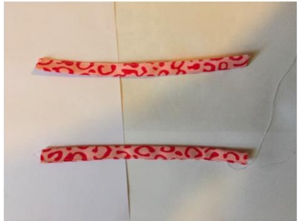
Afbeelding 4: Zo stik je de lussen.