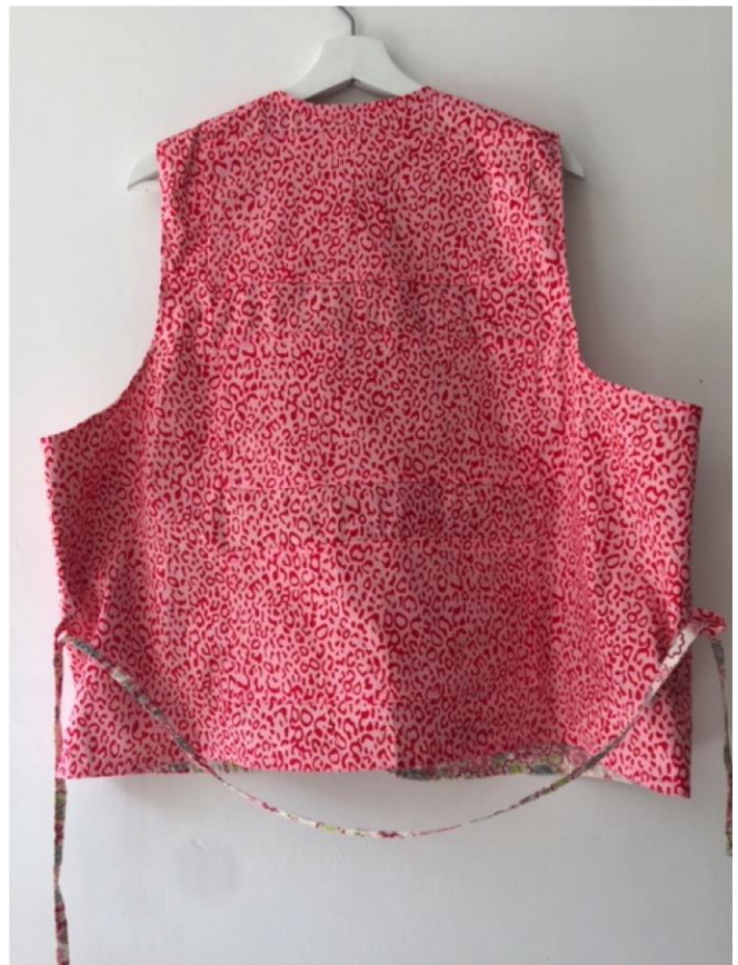
Afbeelding 7: En klaar is je koelvest!