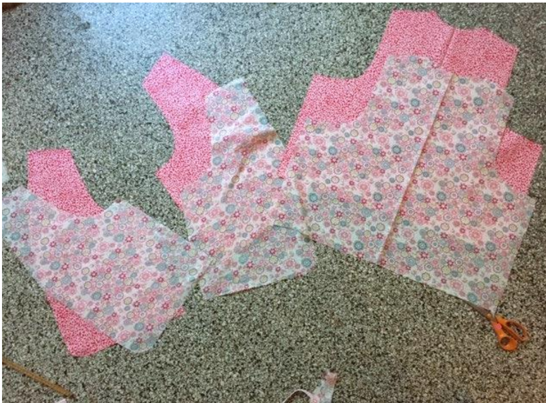
Afbeelding 3: Voilà! Je patroondelen!

3) Nu je alle patroondelen hebt, kan het stikken beginnen: