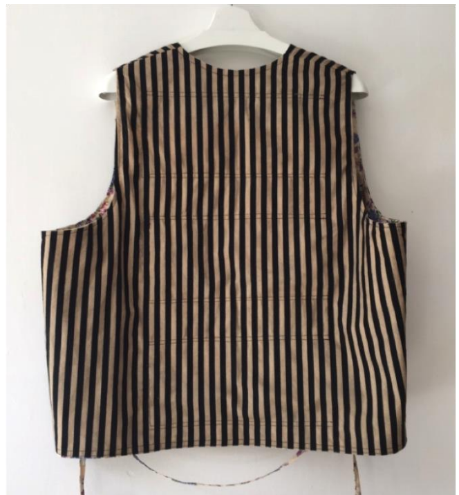
Afbeelding 8: Ander stofje, compleet andere look! Maar even koel...