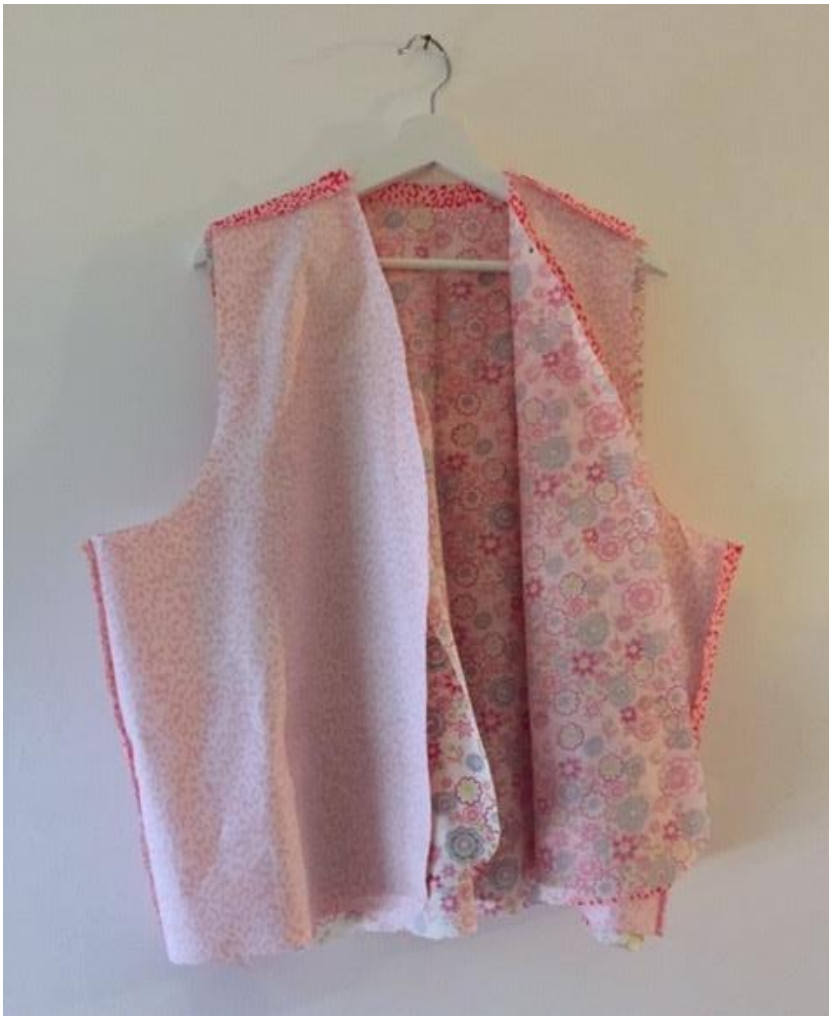
Afbeelding 5: Het begint al ergens op te lijken!