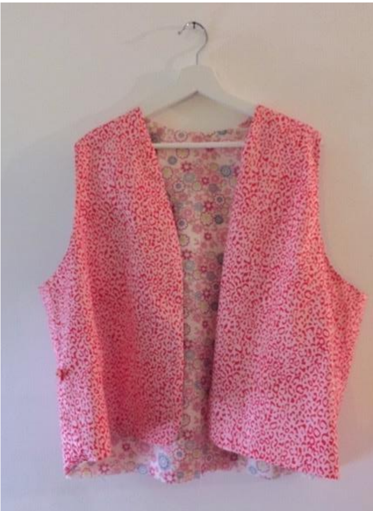
Afbeelding 6: Het vest met de goede kant naar buiten gekeerd. Nu nog de ondernaad, armsgaten en zakken.